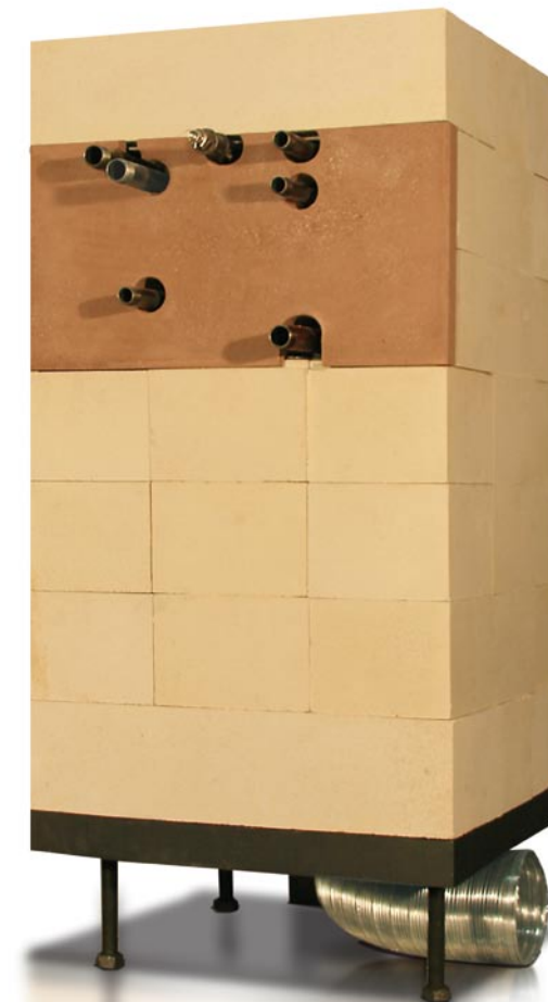
Rückansicht BRULA Komplett-Feuerraum Typ B aquaplus

besten im Heizmedium „Wasser“ speichern. Deshalb ist unser Komplett-Feuerraum Typ B aquaplus mit einem durchdachten Wasser-Wärmetauscher ausgerüstet. Die mit dem nachhaltigen Brennstoff Holz erzeugte Energie kann so via Pufferspeicher für die Beheizung entfernt liegender Räume oder auch zur Bereitung von Brauchwasser genutzt werden. Vorallem in der Niedrighaus-Architektur wird inzwischen oft die Kombination Holzheizung plus Solaranlage realisiert. Der BRULA Feuerraum aquaplus ist für diese Konzepte die erste Wahl.