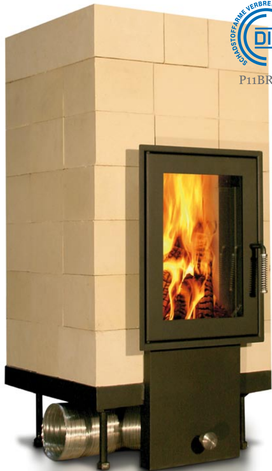
Vorderansicht BRULA Komplett-Feuerraum Typ B plus

KOMPLETT-FEUERRAUM, TYP B PLUS - SAUBER UND DURCHDACHT.